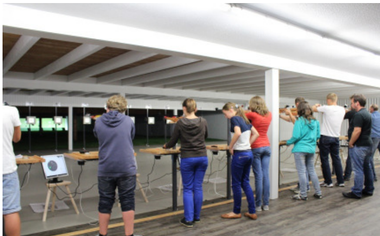
Polnische Austauschschüler aus Chocz (Polen), die z.T. Gäste bei unseren Jungschützen waren