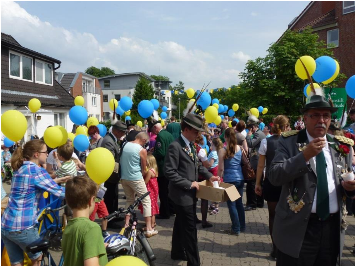
Abbildung 3: Pause am Genslerweg