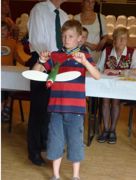
Abbildung 4: Hoch konzentriert beim Vogelstechen

In der Festhalle ging es für den Prinzen und die Prinzessin darum, ihre Titel beim Vogelstechen zu verteidigen. Dabei gilt es, einen Holzvogel, der an einer Kette hängt, mit seinem Eisenschnabel treffsicher auf eine Scheibe zu manövrieren und die höchste Ringzahl zu erreichen. In diesem Wettbewerb traten die Kinder bis 10 Jahren an.